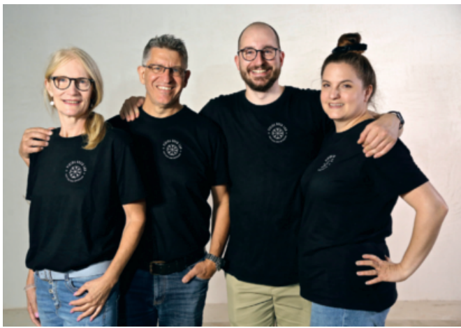
Team, Viking Brew Lab

Das heutige «House of Food» wurde 1946/47 von Maggi als «Flavours Fabrikation» erstellt und galt dazumal schon als Produktionsstätte. Bis zum Jahr 2018 wurde dort u.a. noch durch Givaudan produziert. Nach der Übergabe an die neue Eigentümerin wurde das Gebäude zur Zwischennutzung an Start-ups wiedervermietet.