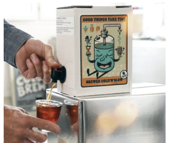
Barrel Coffee AG

Hier lieben und leben wir Bier, wild wie der Ozean, stark wie Wikinger und mächtig wie Walküren. www.vikingbrewlab.ch