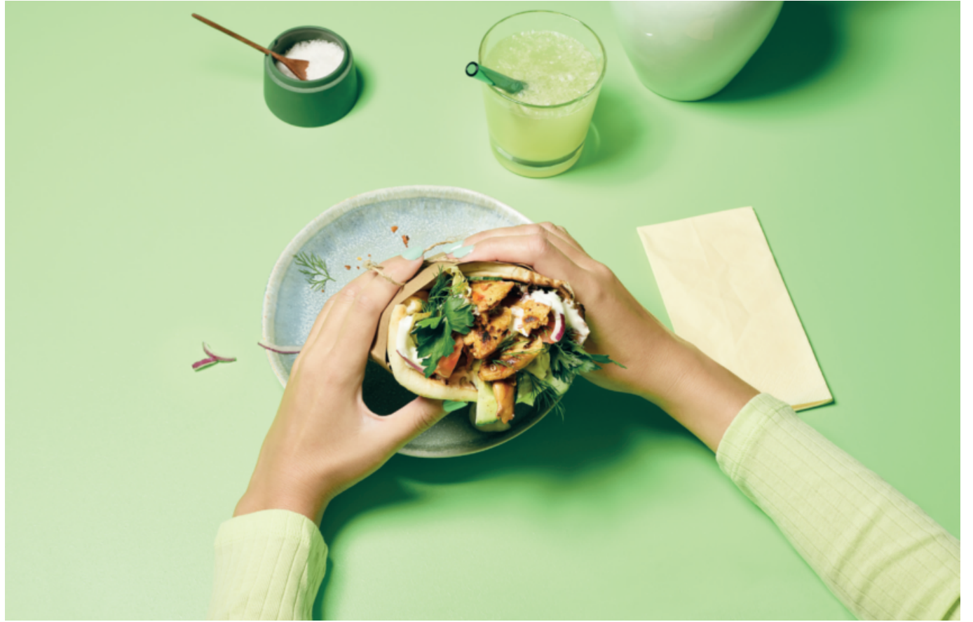
planted Foods AG